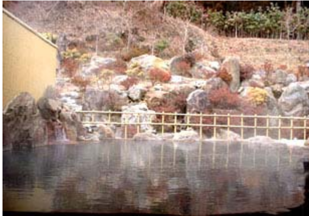
広々とした共同露天風呂

1999年4月にオープン。ロータリーを囲む様に家族湯、露天岩風呂、休憩室、宿泊用貸別荘が配置されています。家族風呂は大小二種類あり、小さい方は内風呂にミニ露天風呂付。大浴場は男女別で岩風呂で半露天等、色々なお風呂が楽しめます。温泉の泉質は、ナトリウム塩化物、炭酸水素塩泉。泉温、61.5℃。効能は、肩こり、神経痛、切り傷等その他、美肌作用もあります。貸別荘もごさいますのでご予約はお早目に・・・