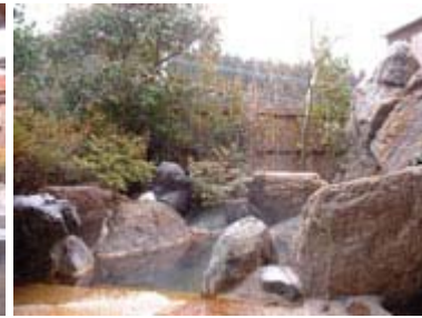
～ 様々な趣と広さの露天風呂～